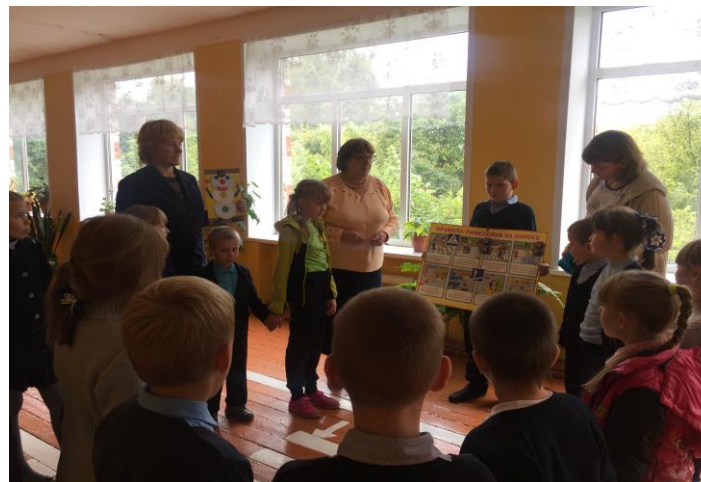
Фото на странице: 2